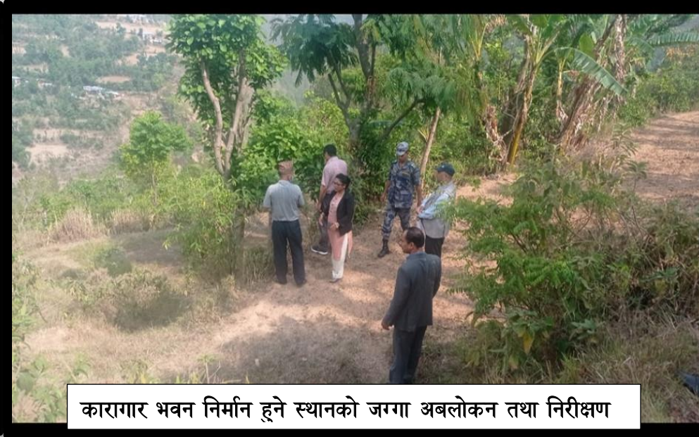
कारागार भवन निर्मान हुने स्थानको जग्गा अबलोकन तथा निरीक्षण