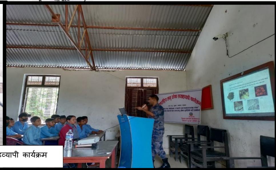
अन्तराष्ट्रिय लागूऔषध सप्ताहव्यापी कार्यक्रम