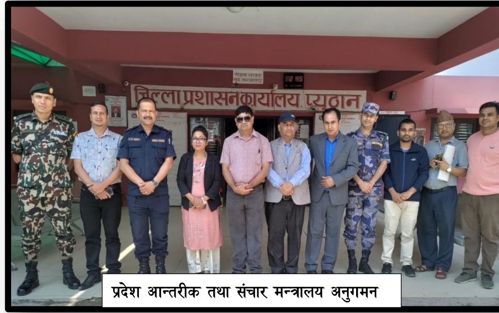
प्रदेश आन्तरीक तथा संचार मन्त्रालय अनुगमन