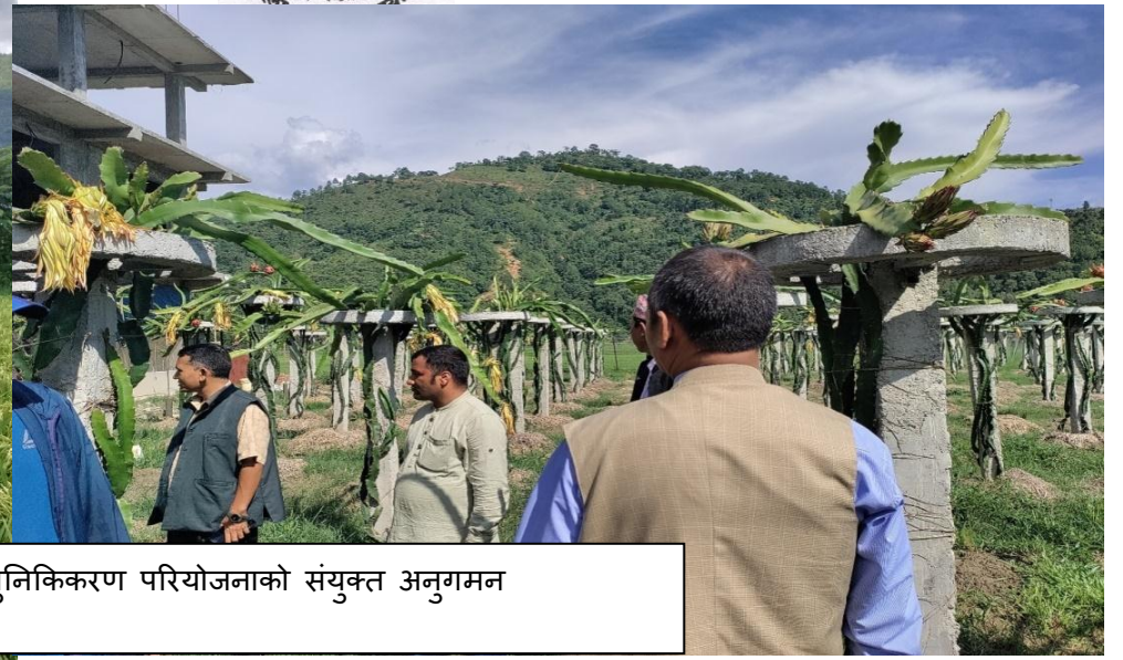
प्रधानमन्त्री कृषि आधुनिकिकरण परियोजनाको संयुक्त अनुगमन