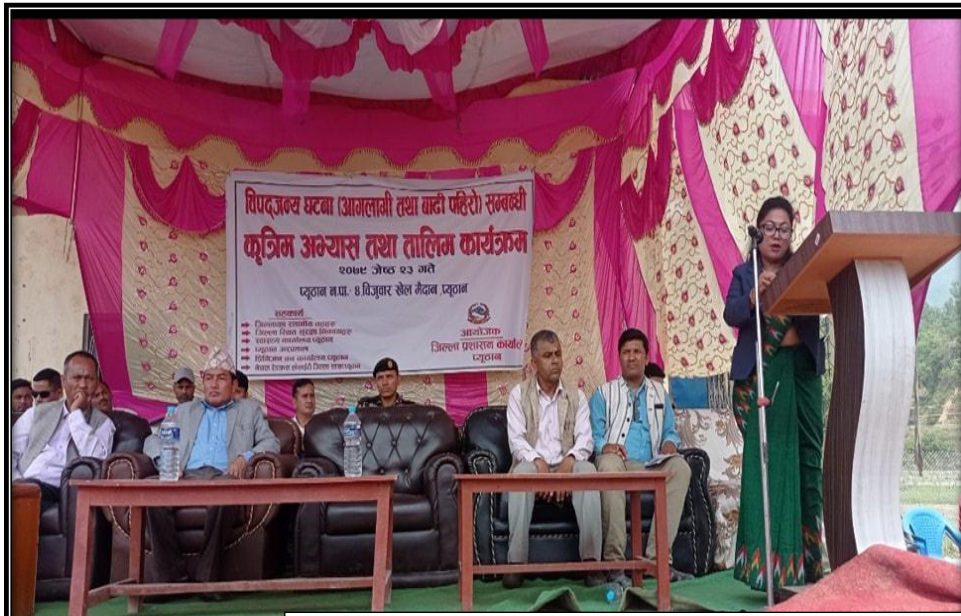
विपद्जन्य घटना (आगलागी तथा बाढीपहिरो) सम्बन्धी कृत्रिम अभ्यास तथा तालिम कार्यक्रम