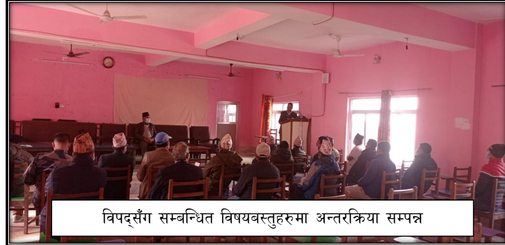
विपद्सँग सम्बन्धित विषयबस्तुहरुमा अन्तरक्रिया सम्पन्न