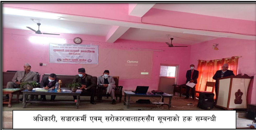
अधिकारी, सञ्चारकर्मी एवम् सरोकारवालाहरूसँग सूचनाको हक सम्बन्धी