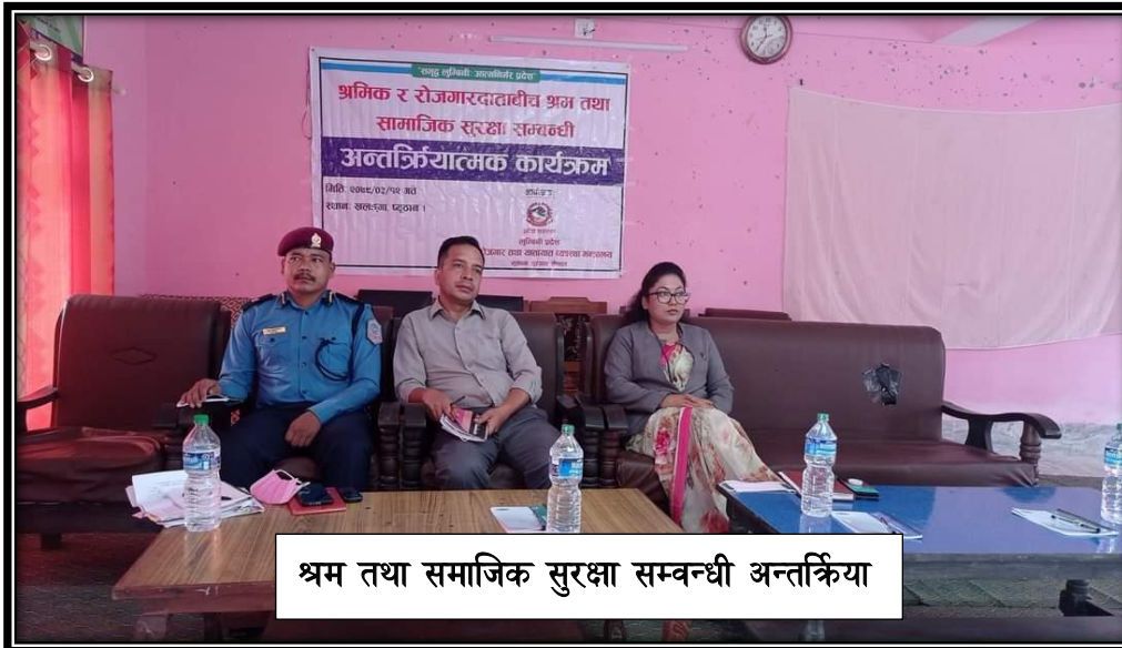
श्रम तथा सामाजिक सुरक्षा सम्बन्धी अन्तर्क्रिया