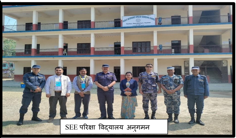
SEE परिक्षा विद्यालय अनुगमन