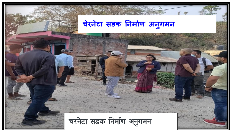
चेरनेटा सडक निर्माण अनुगमन