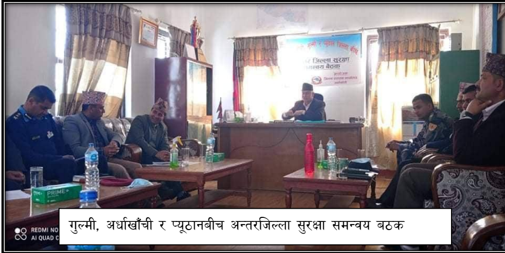
गुल्मी, अर्धाखाँची र प्युठानबीच अन्तरजिल्ला सुरक्षा समन्वय बठक