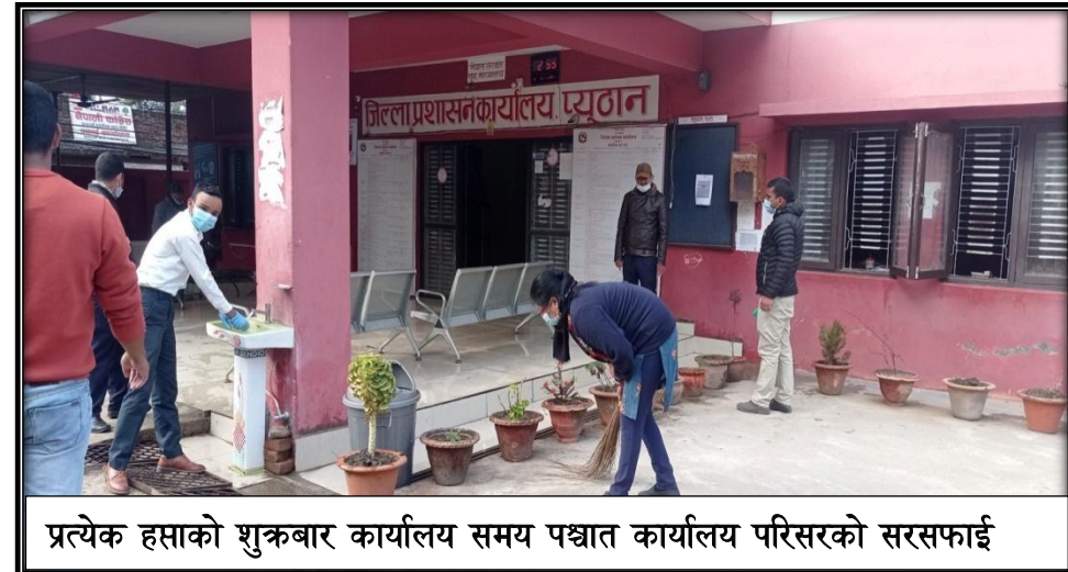
प्रत्येक हप्ताको शुक्रबार कार्यालय समय पश्चात कार्यालय परिसरको सरसफाई